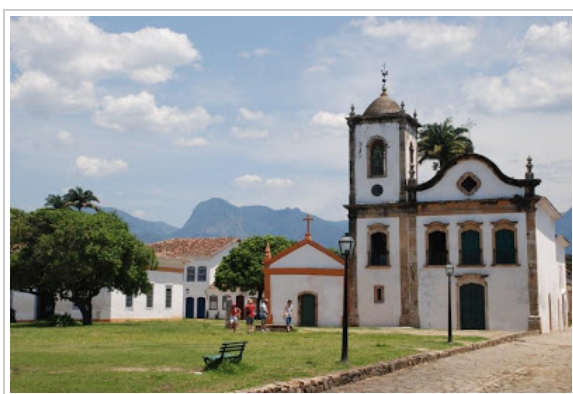
Igreja de Santa Rita no centro histórico.

A sala íntima convida ao relax...Mais informações: http://www.casaturquesa.com.br/ ou tel. (24) 33711037.