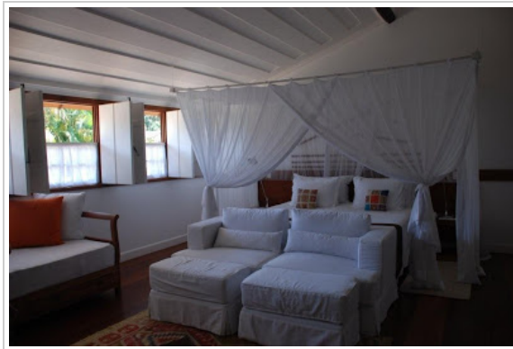
A suíte é um verdadeiro convite ao ócio...