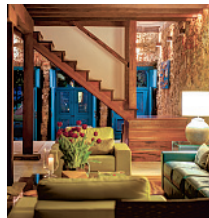
Hotel Casa Turquesa

Casa Turquesa (negen kamers, vanaf €350 per nacht, casaturquesa.com.br) is verreweg het meest luxe boetiekhotel van Paraty. Het prijkt sinds de opening in 2008 hoog op alle luxelijstjes van de Braziliaanse hotelbranche. Toch kan het nog een stuk extravaganter: in het historische centrum en op de eilanden in de baai bevindt zich een groot aantal weelderige villa's waar tropische dromen in overtreffende trap kunnen worden uitgeleefd, inclusief eigen personeel, koks en kapiteins. Op brazilianbeachhouse.com staat een mooie selectie, inclusief een compleet privé-eiland (Ilha do Pico, €1300 per nacht). Een verblijf in Paraty hoeft echter geen vermogen te kosten: een tweepersoonskamer in Geko Hostel ( gekohostel.com ), prachtig gelegen pal aan het strand, kost slechts €30 per nacht. Die prijs is inclusief een caipirinha bij de beachbar.