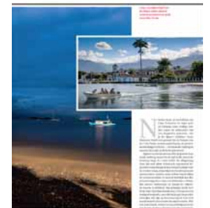
pagina 19, 15-09-2012

Rijden van São Paulo naar Rio de Janeiro kán via de snelweg, maar wie de tijd heeft, neemt de kustweg langs de Costa Verde. De slingerweg door het met dicht Atlantisch regenwoud begroeide kustgebergte is dan wel geen pretje voor de zwakke maag, maar bij de eerste glimp van de spectaculaire baaien, waar talloze watervallen de oceaan in rollen, is meteen duidelijk dat elke minuut langs deze route een belevenis is. Paraty ligt precies halverwege en maant tot blijven. De locatie is idyllisch: het gebergte duikt hier in de baai van Ilha Grande nog even op als een zestigstal tropische, met dichte jungle begroeide eilandjes. Die zijn op hun beurt goed voor zo'n tweehonderd onervalste bountystranden. Wie een kano huurt, of voor een paar tientjes per uur een bootje chartert, heeft ze voor het uitzoeken.