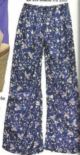
Le Lis Blanc R$ 280