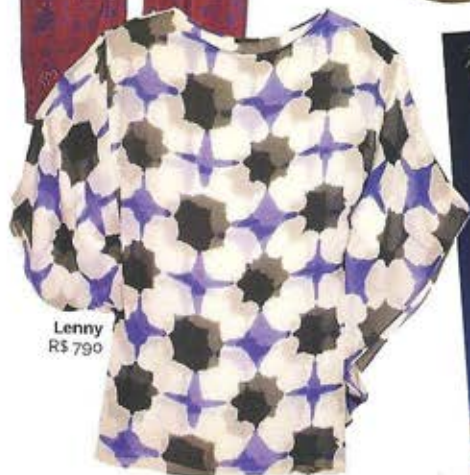
Lenny R$ 790