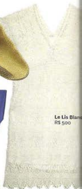
Le Lis Blanc R$ 500