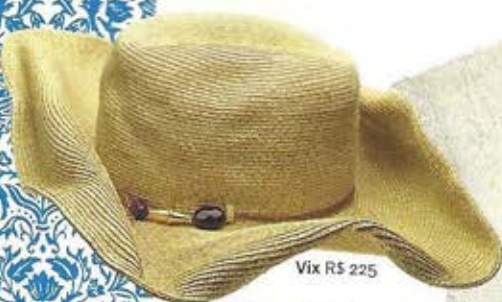
Vix R$ 225