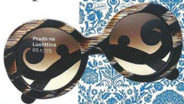
Prada na Luxóttica R$ 1.375