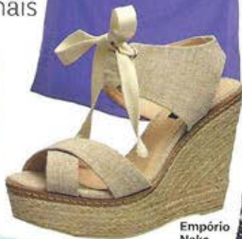
Empório Naka R$ 230