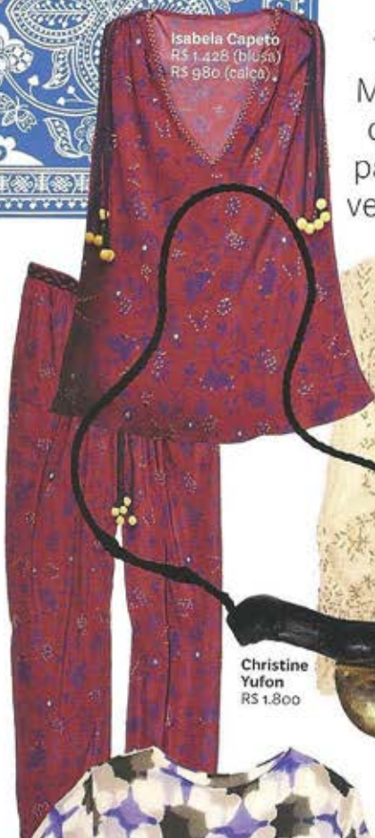
Isabela Capeto R$ 1.428 (blusa) R$ 980 (calça)