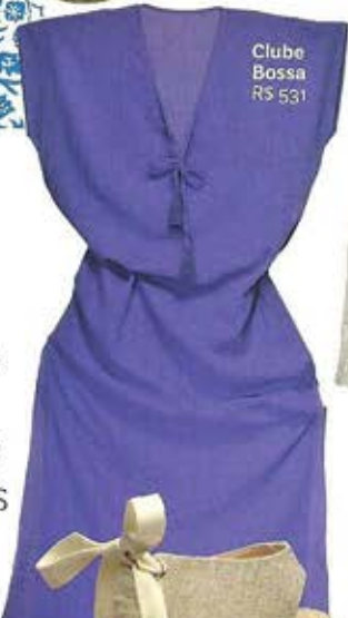
Clube Bossa R$ 531

Misture arte com azulejos coloniais, literatura com passeios de barco e relaxe vestindo roupas artesanais