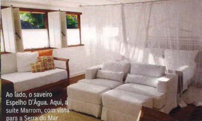
Ao lado, o saveiro Espelho D'Água. Aqui, a suite Marrom, com vista para a Serra do Mar