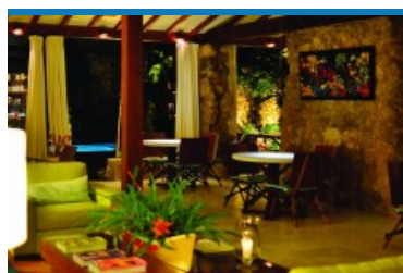
Casa Turquesa, em Paraty: sensação de estar em casa com salas amplas, piscina, sala de leitura e mobiliário assinado

Postado por: Juliana Mariz Seção: Consumo , Estilo de vida