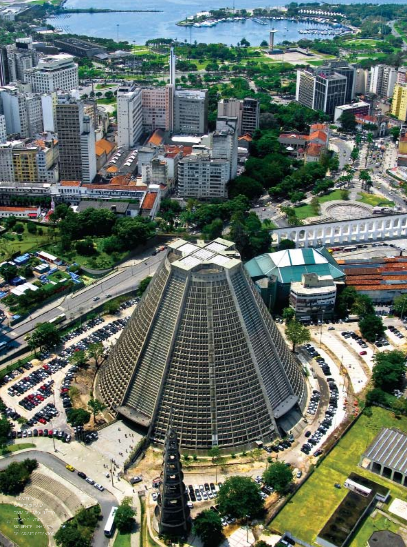
LA CATEDRAL METROPOLITANA, OBRA DEL ARQUITECTO EDGAR OLIVEIRA. SIGUIENTE: UNA VISTA DEL CRISTO REDENTOR.