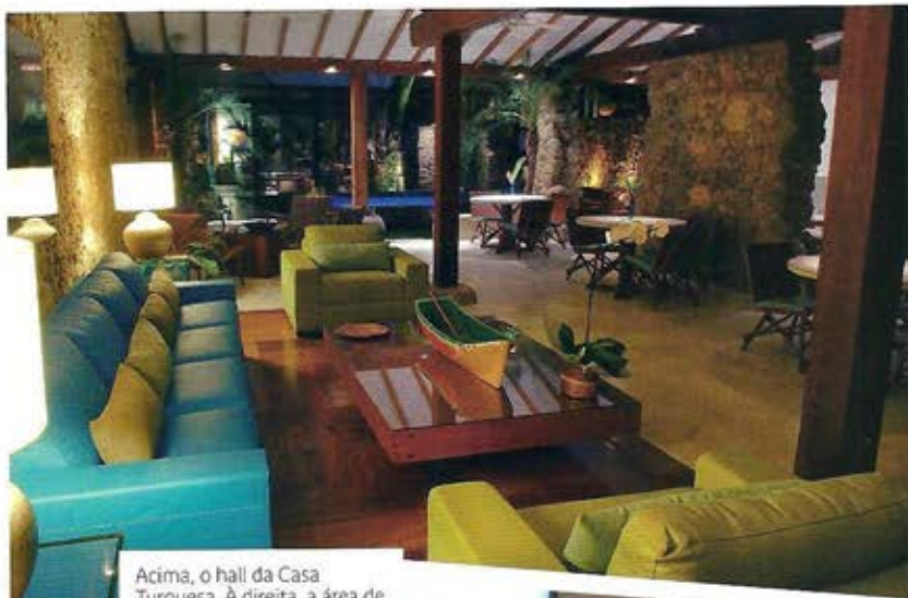
Acima, o hall da Casa Turquesa. A direita, a área de lazer e uma das espaçosas suítes do hotel. À esquerda, a fachada restaurada com projeto de Renato Tavolara, recriando a aparência do antigo sobrado no século 18

Casa Turquesa: Rua Doutor Pereira, 50, tel. (24) 3371-1037 www.casaturquesa.com.br