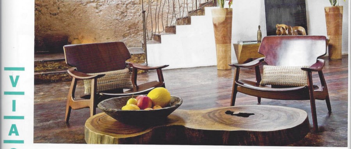
SANTA TERESA: RIO DE JANEIRO